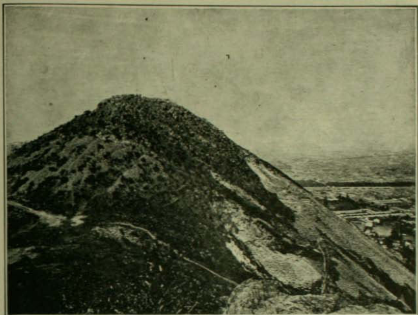
...Aquí y allá diseminados por las laderas cubiertas de yerbas silvestres...

Más que el Santa Lucía, magnífico peñón que constituye un justo orgullo para nuestra ciudad tan pobre en paseos, se impone por su tamaño el Cerro San Cristóbal. Desde cualquier punto que se le busque con la mirada, puede vérselo junto a Santiago como un centinela gigante que medítase sobre el destino de ese medio millón de almas que pulula a sus pies con la agitación de gusanillos. Cualesquiera que sean los trastornos que se operen a su alrededor, el San Cristóbal permanece inmutable, sin perder por un instante su actitud de hombre grave y sesudo. ¡Qué de cosas podría contarnos ese taciturno testigo de la historia de Santiago si una conmoción milagrosa despertara sus entrañas de piedra y pudiera expresar en nuestro idioma sus íntimos pensamientos! Porque él ha visto el nacimiento de los primeros pobladores de esta angosta cinta de tierra y solamente él sabe de dónde vinieron. Desde la Edad de Piedra, ¿desde