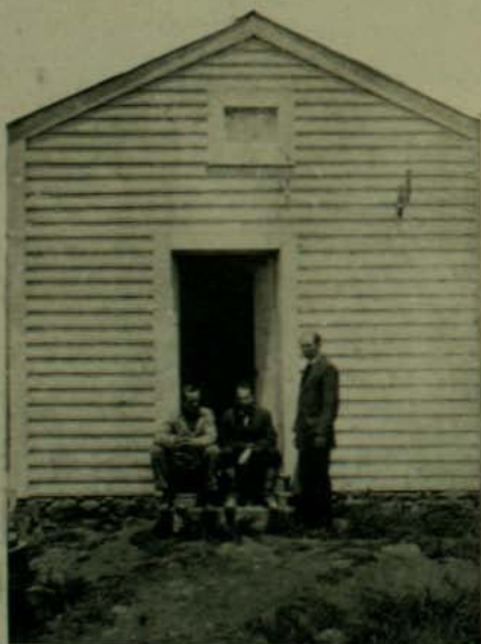
Los miembros de la Comisión norte-americana en la puerta de su casita de la cumbre

Entonces se puede ver el espectáculo curioso y conmovedor de una interminable fila de peregrinos, mujeres en su mayor parte, que sube por el camino en zig-zag de uno de los flancos, como apretada caravana de hormigas, negras, entonando canciones místicas que se elevan angustiosamente al cielo, implorando perdón para las almas pecadoras. La voz grave del sacerdote que los guía, las agudas voces de las mujeres, la misma rusticidad y desafinación de los coros, contri-