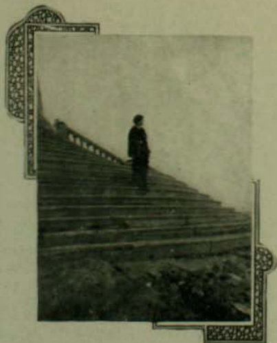
Después de cumplir un voto desciende con el alma aliviada

¡Viejo montículo venerable! Debemos respetarte como un legado hecho por las