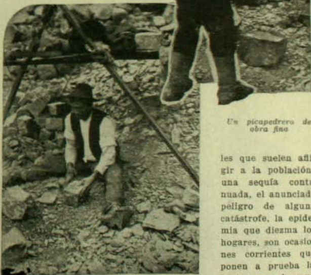
Un picapedrero de obra fina

Desde que existe en la cumbre la imagen de la Virgen, colocada allí por iniciativa de una congregación de religiosos, acude en los días festivos y en determinadas fechas del año, una cantidad de gentes devotas que trepan penosamente sus ásperas laderas para ir a depositar al pie de la enorme estatua, sus preces o sus dávidas sencillas. Son frecuentes las romerías organizadas para suplicar a los poderes divinos una protección para las calamidades materiales o mora-