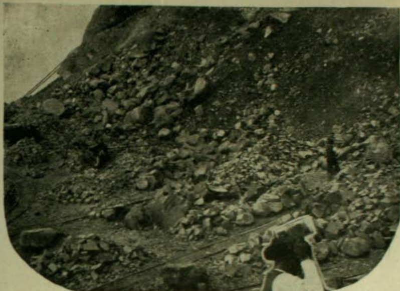
Un aspecto de las canteras que amenazan destruir el San Cristóbal

como un tesoro que sacaremos a luz cuando el destino nos lleve lejos, cuando necesitamos algo que nos evoque la imagen ruda y severa de la patria ausente. El San Cristóbal es lugar de peregrinación y de piedad.