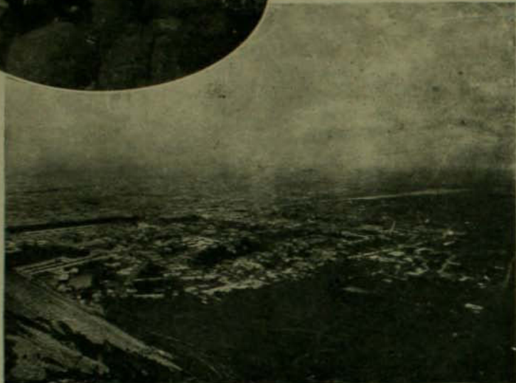
La ciudad se ve desde allí como un campamento de Illiputienses...

mucho antes tal vez? Hasta nuestros días, el viejo San Cristóbal conoce el secreto. Preguntádselo. Nada os responderá. Su reserva tiene algo de la grandeza sagrada del Misterio Eterno.