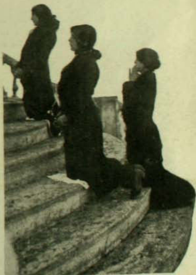
...Acuden al pie de la Virgen devotas de todas edades y condiciones...

Más que el Santa Lucía, magnífico peñón que constituye un justo orgullo para nuestra ciudad tan pobre en paseos, se impone por su tamaño el Cerro San Cristóbal. Desde cualquier punto que se le busque con la mirada, puede vérselo junto a Santiago como un centinela gigante que medítase sobre el destino de ese medio millón de almas que pulula a sus pies con la agitación de gusanillos. Cualesquiera que sean los trastornos que se operen a su alrededor, el San Cristóbal permanece inmutable, sin perder por un instante su actitud de hombre grave y sesudo. ¡Qué de cosas podría contarnos ese taciturno testigo de la historia de Santiago si una conmoción milagrosa despertara sus entrañas de piedra y pudiera expresar en nuestro idioma sus íntimos pensamientos! Porque él ha visto el nacimiento de los primeros pobladores de esta angosta cinta de tierra y solamente él sabe de dónde vinieron. Desde la Edad de Piedra, ¿desde